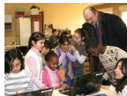
La distribution s'achèvera le 2 mars

Jeudi, c'était Noël à l'école Jules-Verne de Mantes-la-Jolie. A l'instar de toute sa classe,