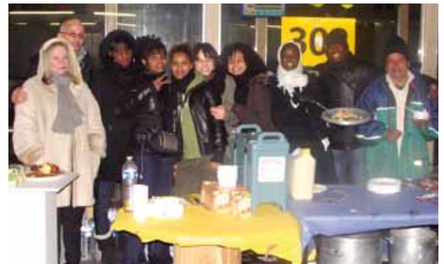
Une quarantaine de repas a été offerte aux SDF

tion d'Auteuil et l'association Lumière dans la rue. « Cette rencontre avec des personnes précaires a provoqué pas mal d'interrogations et de compassion chez les jeunes, soulignent les éducateurs. Elle pourrait se renouveler voire se développer dans la région. Certaines filles sont même intéressées par la création d'une association. »