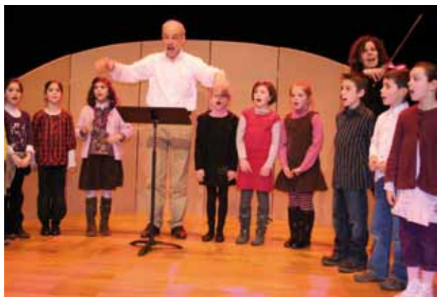
Le concert de la classe Cham a suscité des vocations...

Hauts les chœurs ! Les 220 enfants scolarisés en CP à Mantes-la-Jolie, Mantes-la-Ville et Buchelay qui ont assisté jeudi 12 février à la toute première représentation publique de la Classe à horaires aménagés musicale (Cham) n'avaient qu'une