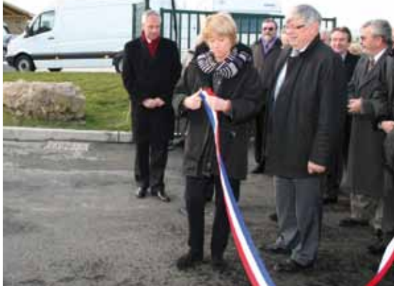
L'aire communautaire des gens du voyage a été inaugurée par la préfète

Ouverte depuis le 8 octobre, l'aire d'accueil pour les gens du voyage, aménagée par la Camy à Buchelay, a reçu la visite de la préfète Anne Bocquet. « Je suis fière de cette réalisation, elle me donne le sentiment que les choses avancent », a déclaré la représentante de